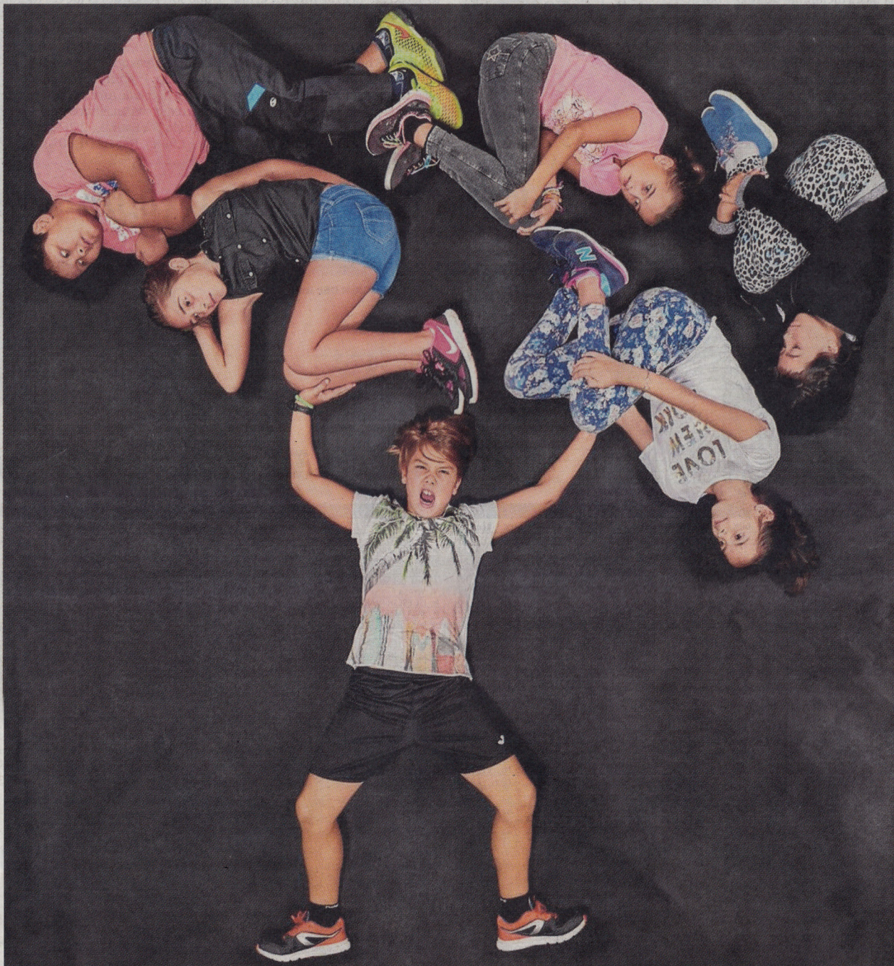
Una de las imágenes de la exposición fotográfica enmarcada en Kooperarock.