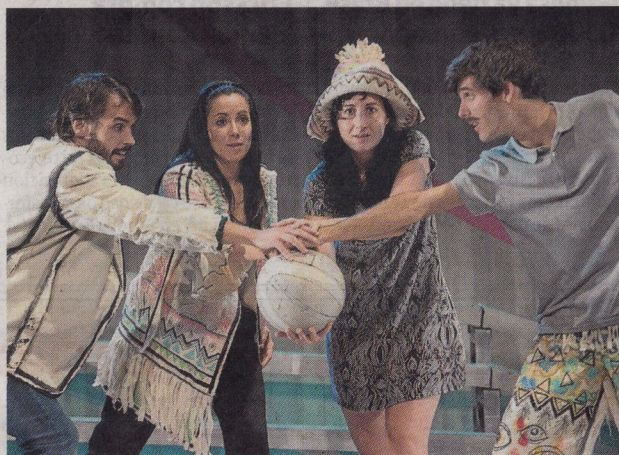
Un momento de la obra teatral que se estrena el día 27.