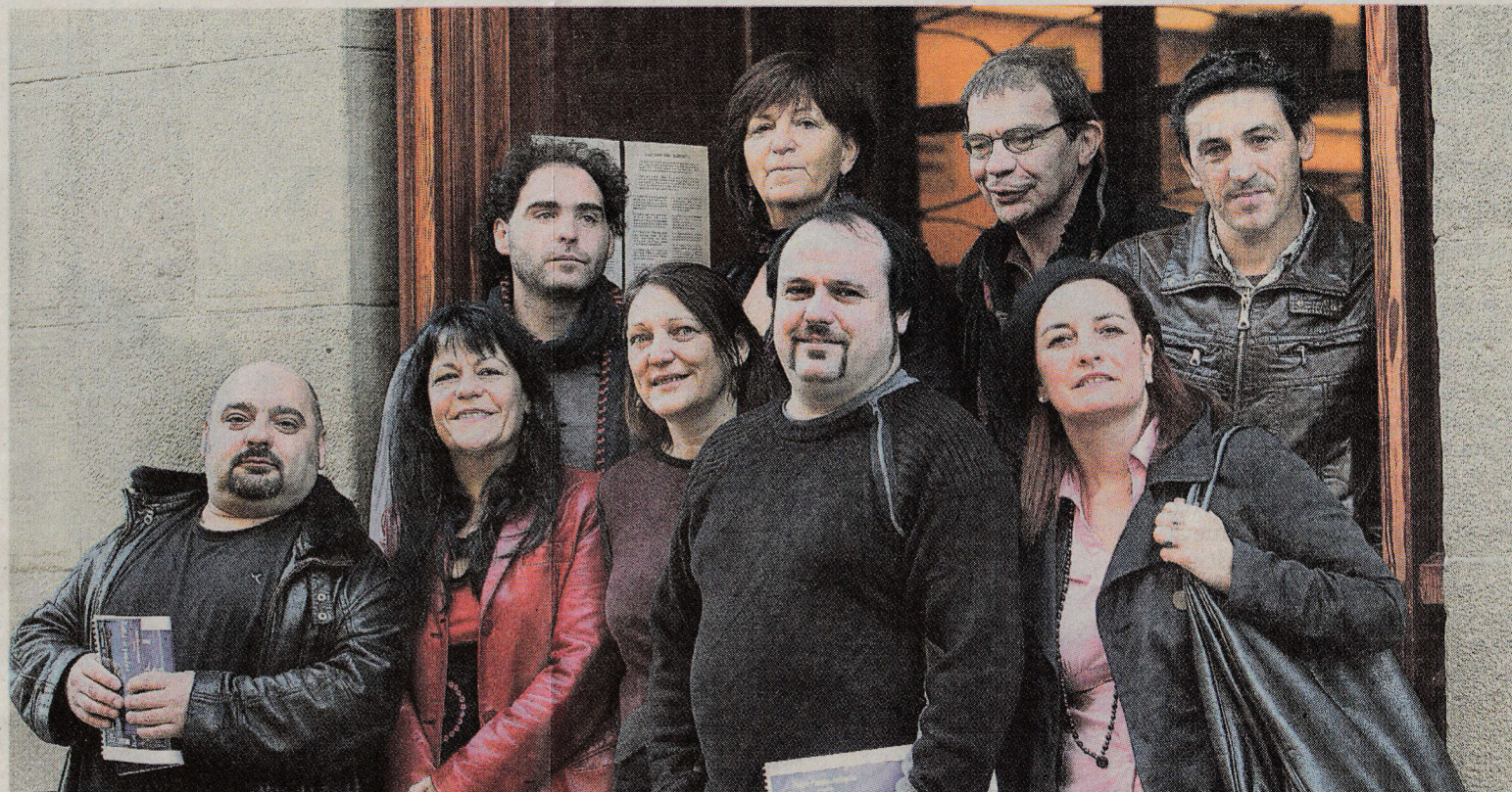
Los integrantes de Teatro Paraíso, a la salida del Principal.

Dirigida especialmente a niños de 7 a 11 años y al público familiar, el montaje gira en torno a la idea de que para sobrevivir al ciclón es necesario dejar en tierra a las aves más débiles: aquéllas que no pueden volar. Así, a los animales abandonados «no les queda otra que entenderse y contribuir entre todos aportando su talento». Y no será nada fácil,