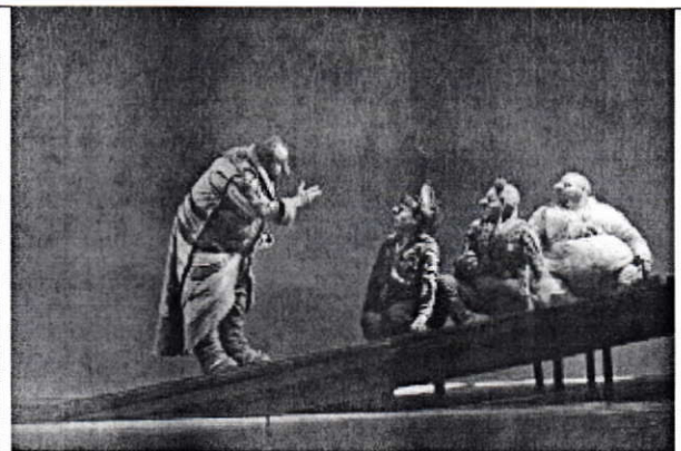
Sala Cuarta Pared.

para todas las edades nace de la comunicación que se establece con el público infantil; una comunicación basada en la misma inteligencia y tacto con la que habitualmente se agasaja al adulto. Y esto es algo, como supondrán, poco habitual en el panorama del teatro infantil .