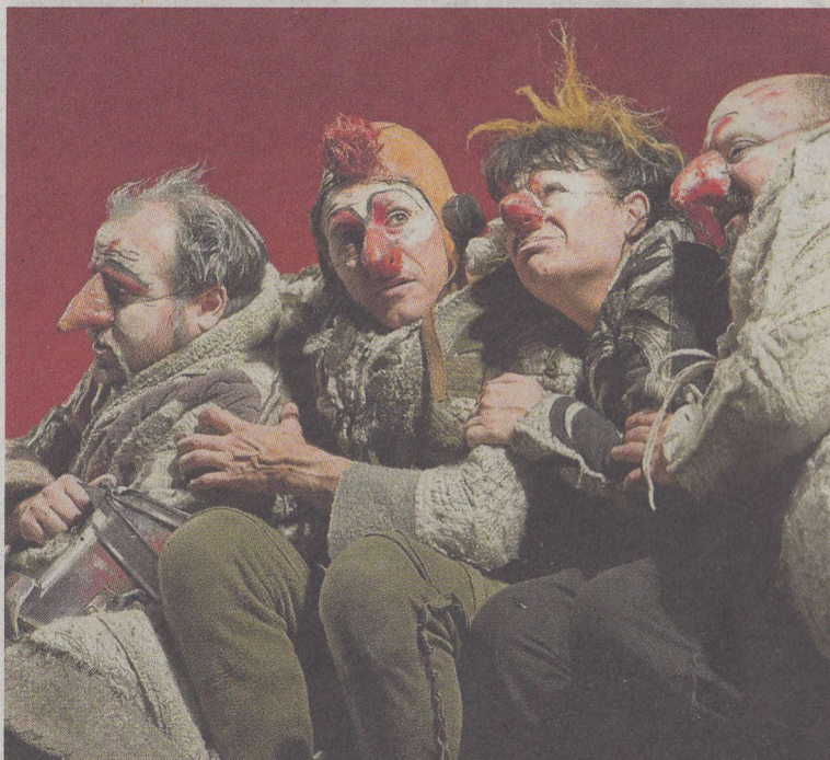
Los actores de Teatro Paraíso, en 'Vuela si puedes'.

no se trata tan solo de una función, desarrollada en colaboración con el grupo belga Les Ateliers de la Colline. En 'Vuela si puedes' hay cuatro pájaros con diferentes problemas para despegarse del suelo que están atrapados en una isla, mientras se avecina un ciclón.